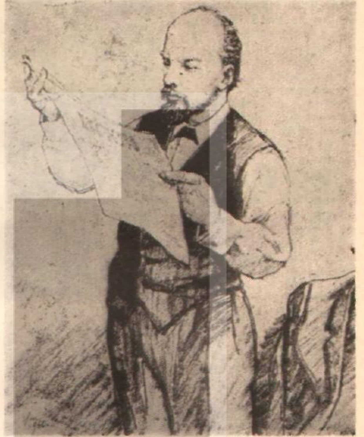
Lenin, İskra'yı İnceliyor

B u bakıma, her şeyden önce, siyasi iktidarı ele geçirme yolunun, her zaman ve her yerde geçerli olabileceği şekilde, tek bir formül halinde belirlenemeyeceği söylenebilir. Tek bir formül halinde belirlenemeyecek şey, sosyalist devrimin «özünü». Sosyalist devrimin «özünü», zamana ve yere göre değişmez. Ama bunun böyle olması, sosyalist devrimin her zaman ve her yerde aynı biçimde yürüneceği, aynı yoldan gerçekleşeceği anlamına gelmez. Siyasi iktidarı ele geçirmenin çeşitli araçları, çeşitli yolları olabilir. Sosyalist devrimin şeklini, sosyalist devrimin gerçekleşme yolunu, yaşanan çağın genel şartları, bir ülkenin somut şartları ve millî özellikleri, devrimci durumun yoğunluk derecesi, mücadele halinde bulunan sınıflar arasındaki güç dengesi, işçi sınıfının ve burjuvazinin bilinç ve örgütlenme derecesi gibi faktörler, bir arada, belirler. Yani sosyalist devrimin barışçı ya da ihtilâlcî yoldan gerçekleşme imkânı, sınıf mücadelesinin gelişme düzeyi, gerginlik derecesi, egemen sınıfların direnme gücü ve direnme şekli dahil, ülkenin iç ve dış somut durumuna bağlıdır. Devrimci mücadele şekilleri olsun, devrimin gerçekleşme